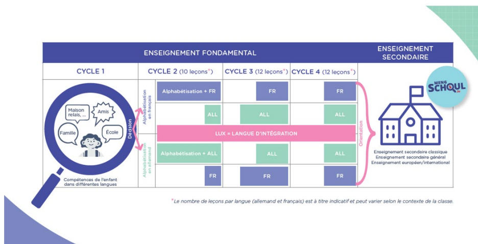
GRAPHIQUE 4 : APERÇU DU PROJET PILOTE

l'apprentissage des langues au plus tard à partir de cette dernière année scolaire passée à l'école fondamentale.