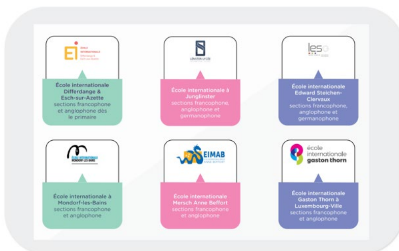
GRAPHIQUE 1 : LES ÉCOLES INTERNATIONALES PUBLIQUES DE L'EF AU LUXEMBOURG

Dans une première phase, cette vision de politique éducative a été réalisée par la création d'écoles internationales publiques. Lors de l'ouverture de la première de ces écoles à Differdange en 2016, le ministre de l'Éducation nationale, de l'Enfance et de la Jeunesse a expliqué « [qu'] avec plus de 60% des élèves qui n'ont pas le luxembourgeois comme première langue et plus de 2000 jeunes primo-arrivants qui rejoignent notre système éducatif au cours de l'année scolaire, nous ne pouvons pas nous limiter à un seul modèle de scolarisation. Pour offrir une chance de réussite à chaque jeune indépendamment de la langue parlée à la maison, nous devons diversifier l'offre scolaire du système public pour mieux l'adapter aux profils très différents. Il y va du maintien de la cohésion sociale, mais aussi de la prévention de l'échec et du décrochage. » 2