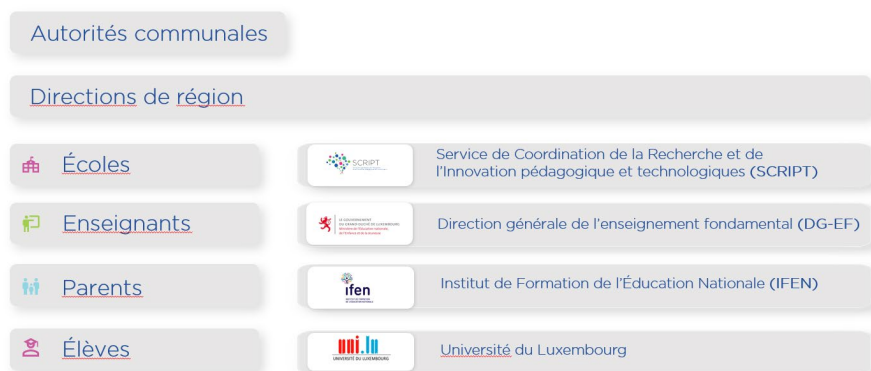
GRAPHIQUE 5 : LES PARTIES PRENANTES